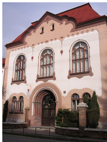
Obr. č. 2: Hlavný objekt SPŠ strojníckej