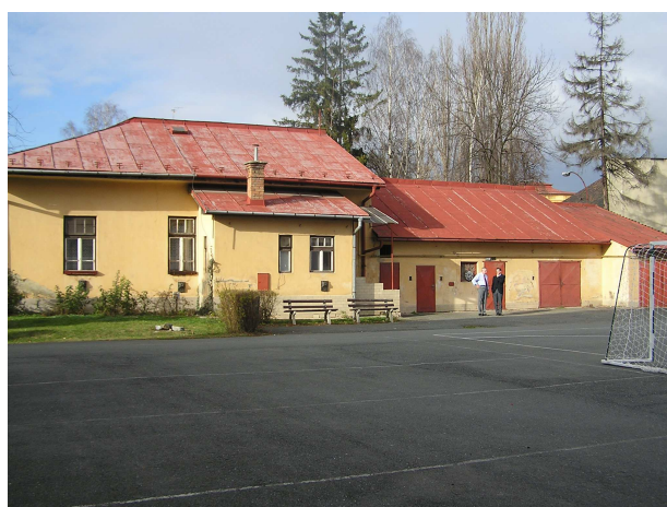
Obr. č. 6: Byt domovníka s dielňami a garážou