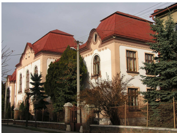
Obr. č. 3: Hlavný objekt SPŠ strojníckej