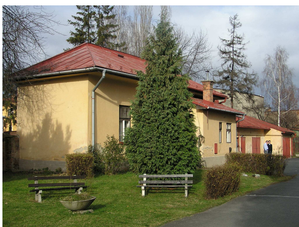
Obr. č. 5: Byt domovníka s dielňami a garážou