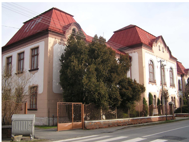
Obr. č. 1: Hlavný objekt SPŠ strojníckej