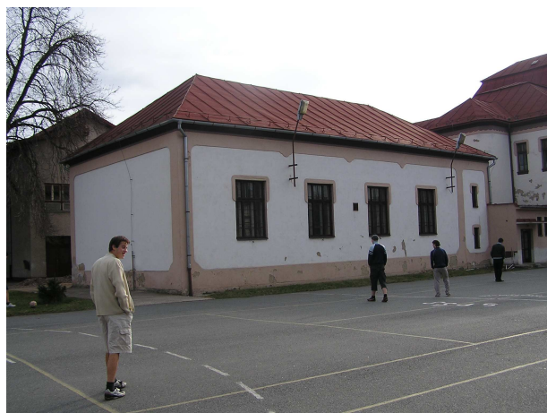
Obr. č. 4: Telocvična SPŠ strojníckej